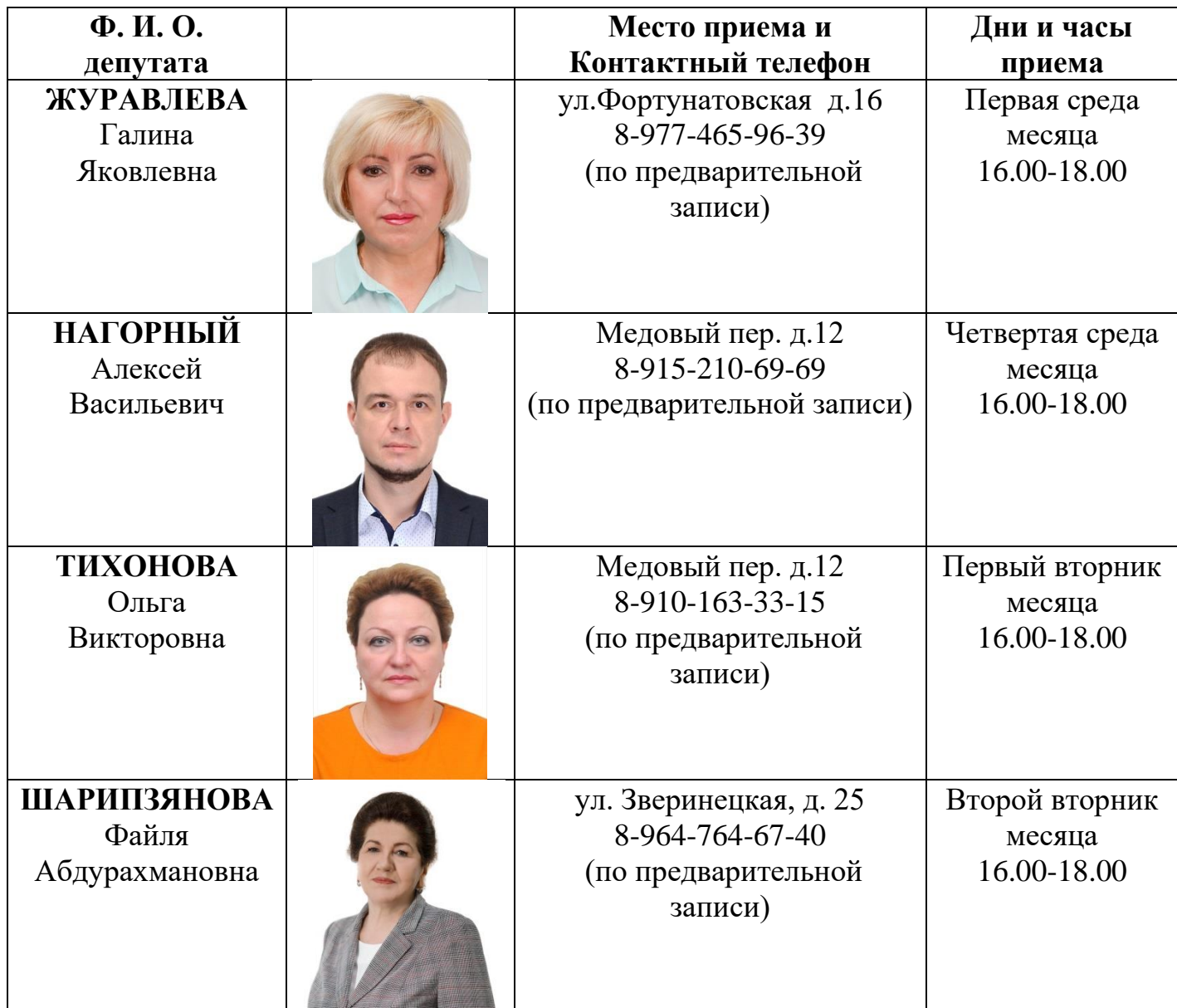
График приёма депутатов Совета депутатов муниципального округа Соколиная гора города Москвы Избирательный округ №1

Приложение к решению Совета депутатов муниципального округа Соколиная гора от 18.10.2022 № 2/3